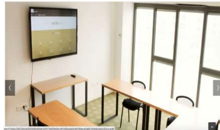
Salle de Formation Workeen avec tout le matériel nécessaire

En région Occitanie et sur l'ensemble des grandes villes de France et en Corse DROM/TOM