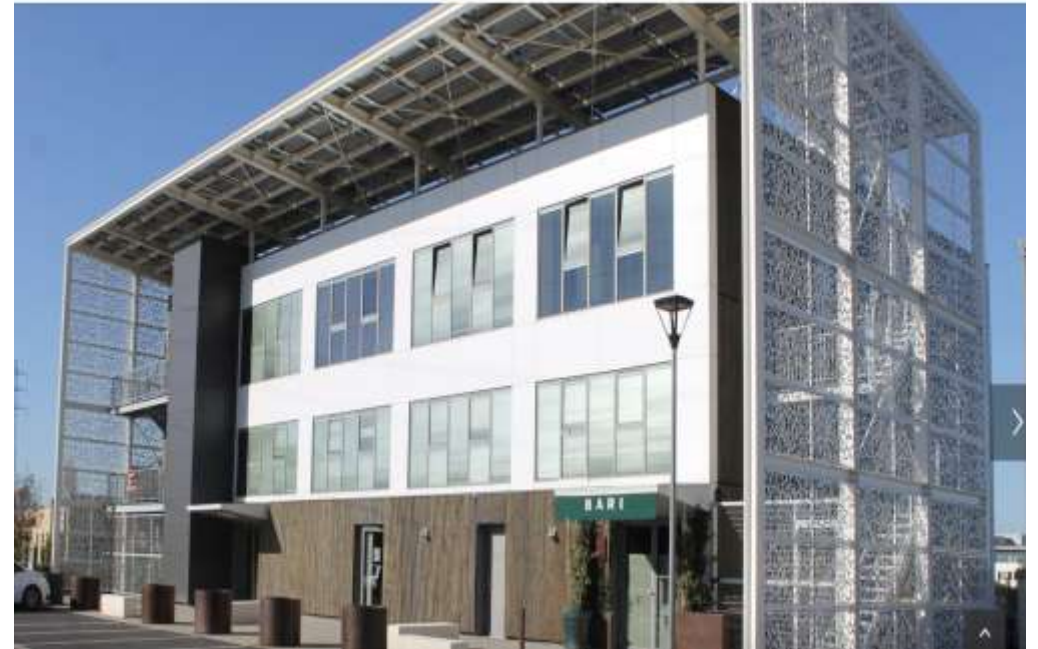
Les locaux de Workeen à Castelnau Le Lez

Un espace de restauration est également mis à disposition par Coworkeen, des formules de livraison de repas sont également possibles.